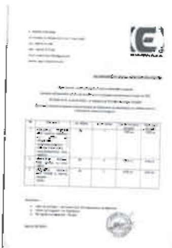
214703.JPG ~1,8 МБ

гр. Пловдив, ул. Менделев 2 А, ет. 3, офис №38 тел.: +359 32 511 338 моб.: +359 89 7777 669 email: cnwsolution.office@gmail.com website: www.cnwsolution.com